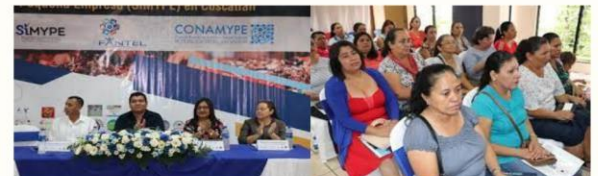
Figura 3: Apertura de Sistema de Desarrollo

Las MYPES enfrentan diversos obstáculos, el principal es la falta de financiamiento para obtener capital y realizar las actividades empresariales, esta exploración se contrasta con el análisis realizado por la Superintendencia de Competencia, un Estudio sobre la caracterización del mercado de prestación de servicios financieros a las Micro y Pequeñas Empresas. (Molina, 2017, págs. 37-38)